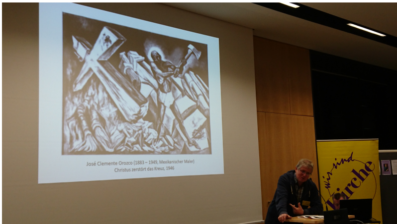
Einführung in die Friedensthematik durch Günther Doliwa ...