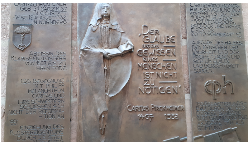
Caritas Pirckheimer (1467-1532): "Der Glaube und das Gewissen eines Menschen ist nicht zu nötigen"