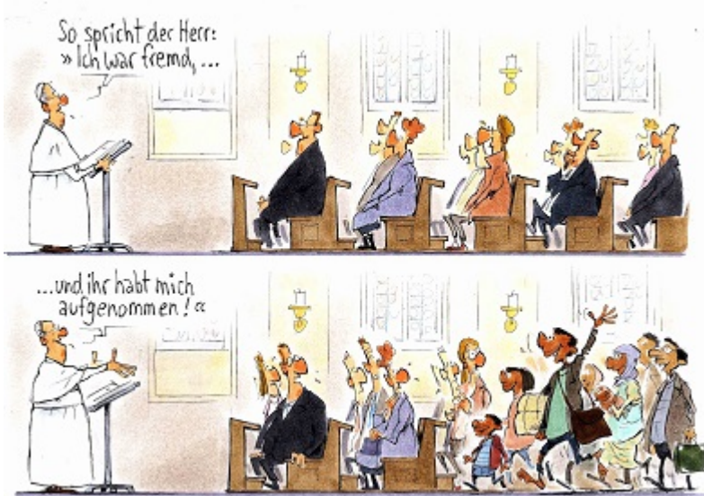
So spricht der Herr: "Ich war fremd,... und ihr habt mich aufgenommen!"

Die Kirchen haben auch die wichtige Aufgabe zu, den wachsenden Widerständen gegen Flüchtlinge in Wort und Tat zu begegnen, so wie es Papst Franziskus unmissverständlich tut. Die Aufgaben sind immens: hier die Asylsuchenden aufnehmen und in den Herkunftsländern die Fluchtursachen bekämpfen. Aber, so Papst Franziskus im Apostolischen Schreiben „Evangelii Gaudium“ (2013): „ Solange die Probleme der Armen nicht von der Wurzel her gelöst werden, ... werden sich die Probleme der Welt nicht lösen und kann letztlich überhaupt kein Problem gelöst werden. Die Ungleichverteilung der Einkünfte ist die Wurzel der sozialen Übel. “