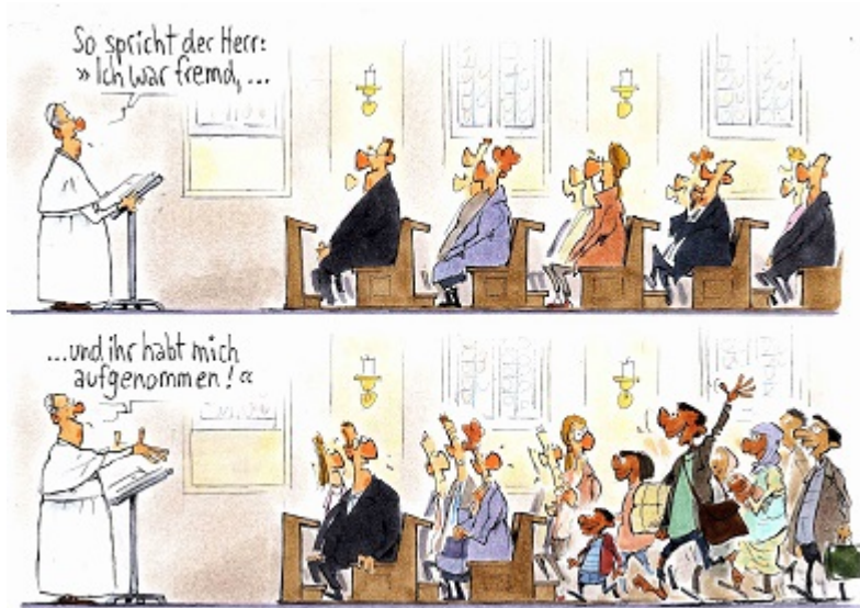
So spricht der Herr: "Ich war fremd,... und ihr habt mich aufgenommen!"

Die Kirchen haben auch die wichtige Aufgabe zu, den wachsenden Widerständen gegen Flüchtlinge in Wort und Tat zu begegnen, so wie es Papst Franziskus unmissverständlich tut. Die Aufgaben sind immens: hier die Asylsuchenden aufnehmen und in den Herkunftsländern die Fluchtursachen bekämpfen. Aber, so Papst Franziskus im Apostolischen Schreiben „Evangelii Gaudium“ (2013): „ Solange die Probleme der Armen nicht von der Wurzel her gelöst werden, ... werden sich die Probleme der Welt nicht lösen und kann letztlich überhaupt kein Problem gelöst werden. Die Ungleichverteilung der Einkünfte ist die Wurzel der sozialen Übel. “