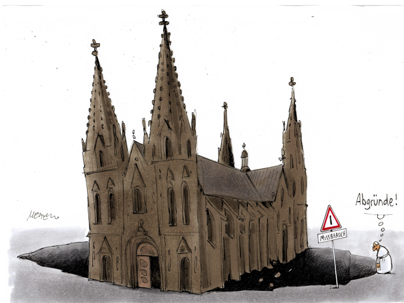
Karikatur: © Gerhard Mester

Wir sind Kirche-Petition zum Offenen Brief an Kardinal Marx