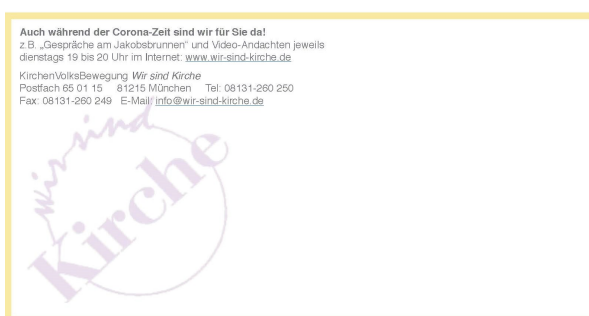
Wir sind Kirche-Osterkarte 2021 Rückseite