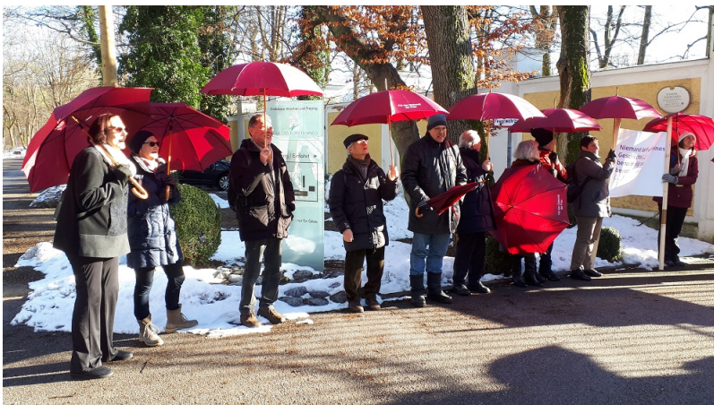
... mit mehr als 20 Frauen und Männern von Münchner Kreis, Gemeindeinitiative und Wir sind Kirche