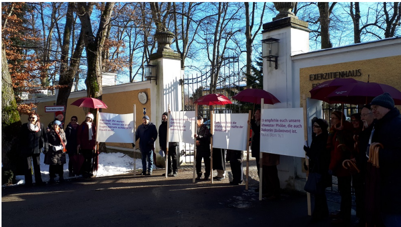
Mahnwache von 11 bis fünf vor 12 vor dem Eingang zum Exerzitenhaus Fürstenried ...

Pressefotos in größerer Auflösung bei presse@wir-sind-kirche.de anforderbar