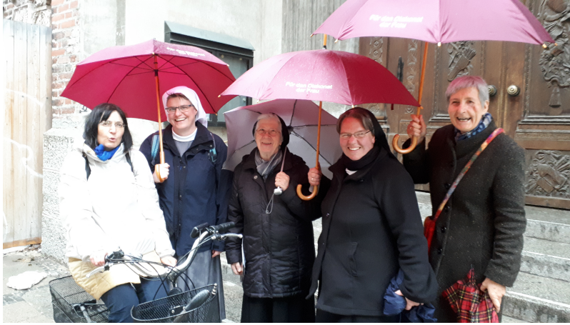
Mit dabei "Ordensfrauen für Menschenwürde"