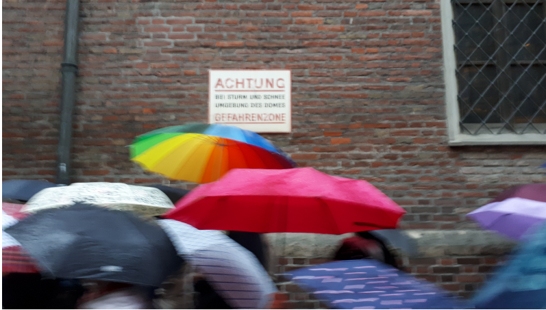
Gefahrenzone in der Umgebung des Domes - bei Sturm und Schnee