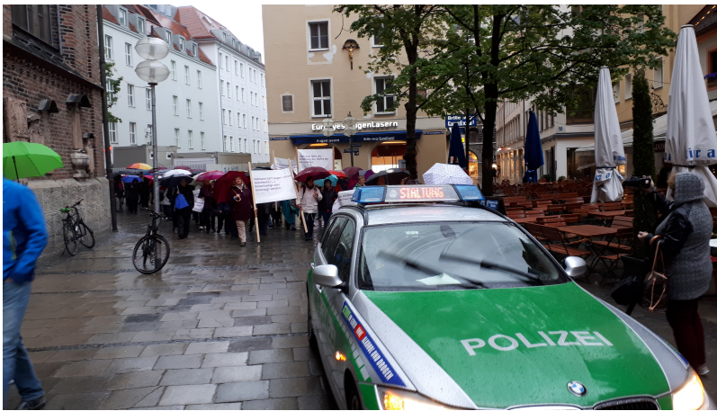
Beschützt von zwei Polizeiwagen am Anfang und Ende des langen Zuges