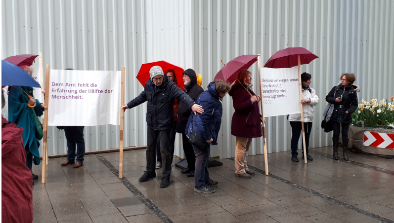
Aufstellung neben St. Michael in der Ettstraße

Pressefotos in größerer Auflösung bei presse@wir-sind-kirche.de anforderbar