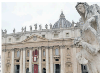
Die Bewegung „Wir sind Kirche“, die aus einem Kirchenvolksbegehren hervorging, setzt sich für eine Erneuerung der katholischen Kirche ein. Der Petersdom im Vatikan, als Herzstück der katholischen Kirche, steht dabei symbolisch für den Ort, an dem diese Reformen angestrebt werden sollen.