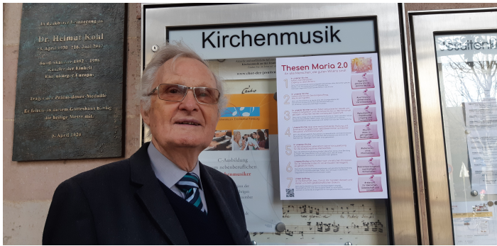
Dom zu Speyer