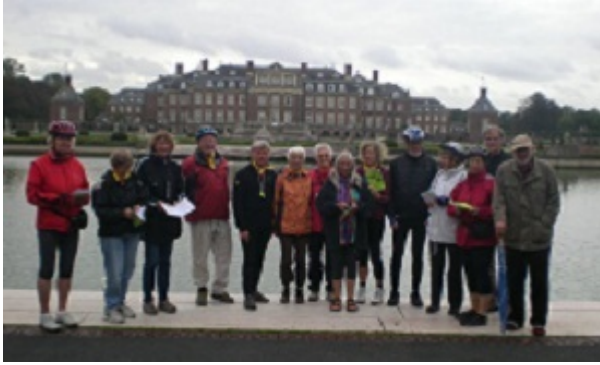
das Schloss Nordkirchen.

Zu diesem westfälischen "Versailles" gibt es mehr im unten stehenden Bericht eines Fahrrades.