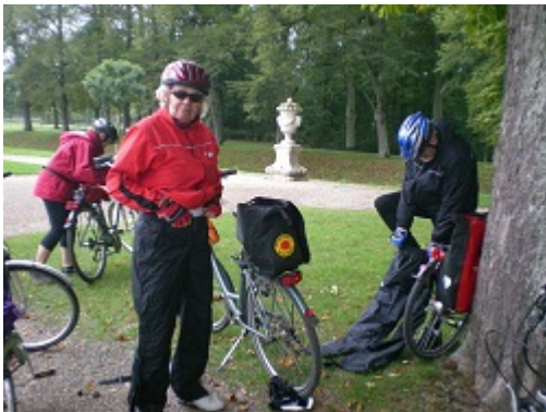
Rin inne Klamotten - raus ausse Klamotten. Regen und Wind haben uns viele Stunden begleitet.