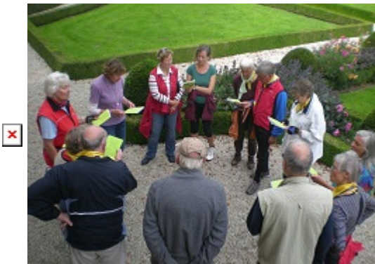
Das letzte gemeinsame Abendmahl und die Abschiedsrunde am Rüschaus.

Es war eine Tour mit vielen Eindrücken, guten und persönlichen Gesprächen und Erfahrungen. Der Abschied fiel uns schwer.