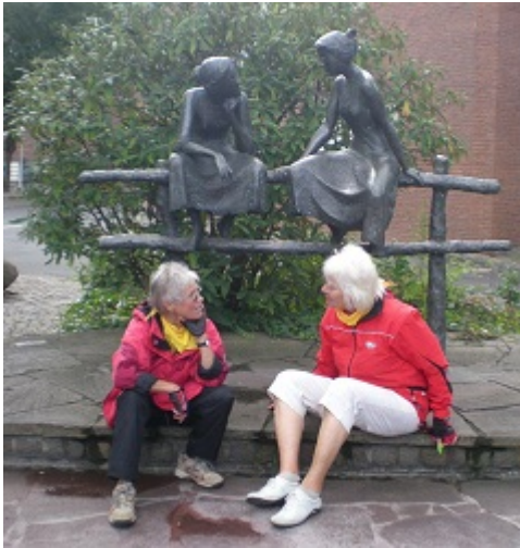
Klönschnack auf dem Dorfplatz