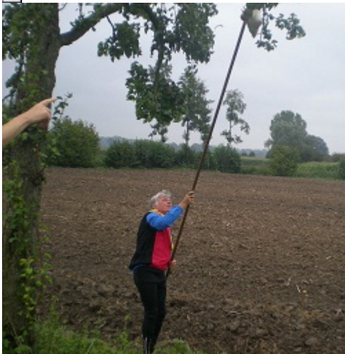
Apfelpflücken am Weg (nein, wir haben nicht unser Taschengeld damit verdient)