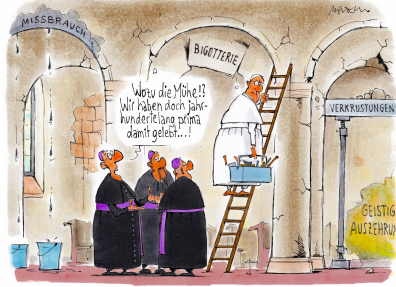
Renovierungsbedarf im Hause Gottes