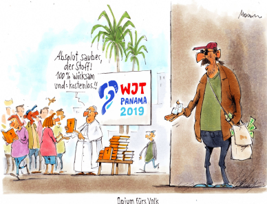
Opium fürs Volk