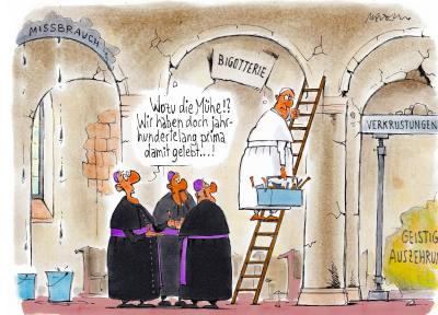
Renovierungsbedarf im Hause Gottes