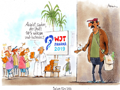
Opium fürs Volk