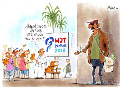
Optim Görs Volk