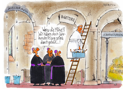
Renovierungsbedarf im Hause Gottes