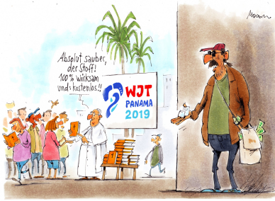
Optim fürs Volk