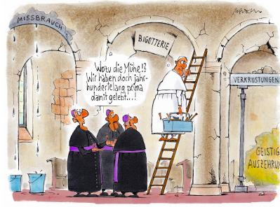
Renovierungsbedarf im Hause Gottes