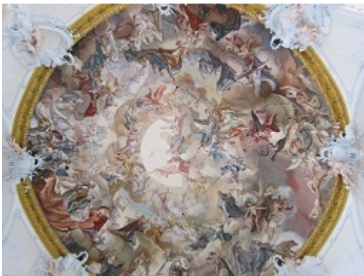
Deckenbild der Klosterkirche

Morgenlob im Hof des Schneiderwirtes, eine von uns beging heute ihren 70. Geburtstag. Vorbei an Rosenheim - der Regen lässt nach - trafen wir uns in Rott am Inn zur Mittagspause und zur Führung in der Klosterkirche.