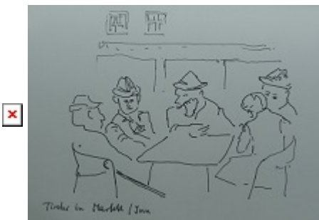
Impressionen in Markt

in den Wallfahrtsort Altötting - das Gnadenbild der schwarzen Madonna knüpfte das Band zur letzten PilgerRadTour 2013 über das Gnadenbild von Kevelaer - ,