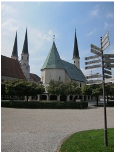
Mittagspause in Altötting

Nach dem Morgenlob auf einer Obstwiese hinter unserem Hotel, kamen Ortsbilder und Kirchen an diesem Tag zu Hauf. Der Stadtplatz von Mühldorf, der Ausflug über Neuötting