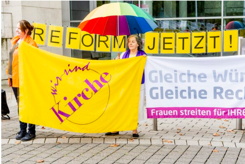
Synodaler Weg / Maximilian von Lachner

Donnerstag, 8. September 2022: Sprachlos!