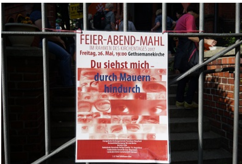
Plakat für das Feier-Abend-Mahl (Dieter Wendland)