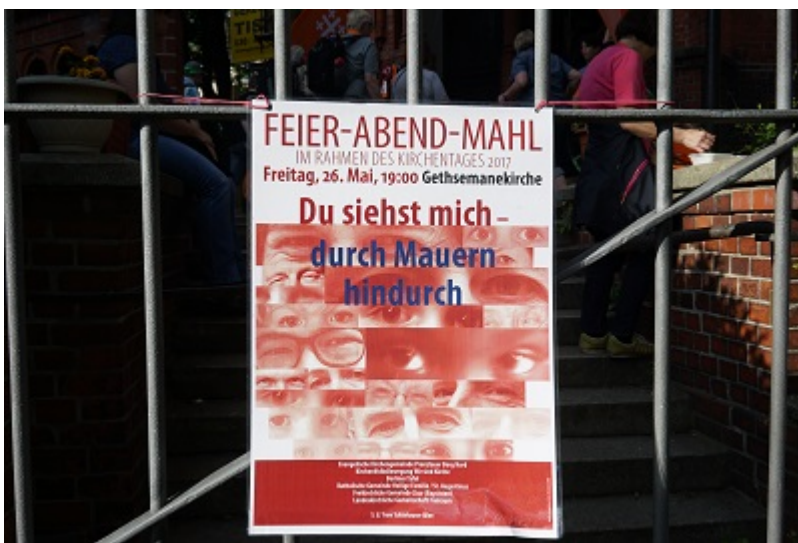
Plakat für das Feier-Abend-Mahl (Dieter Wendland)