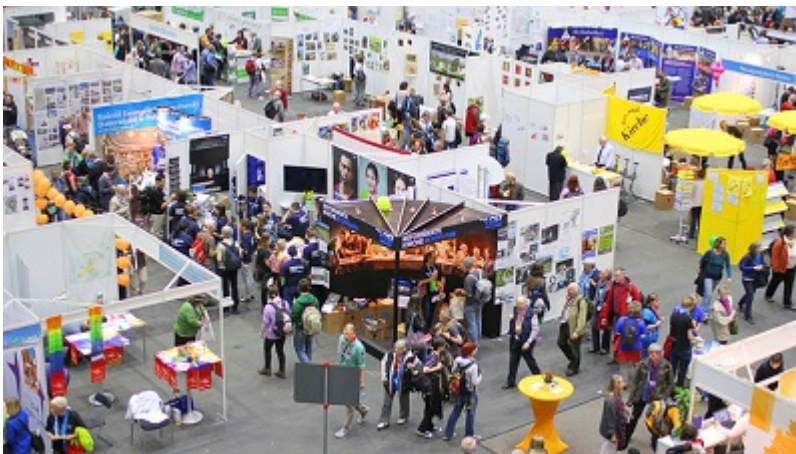
Auf diesem Foto auf der Webseite des Ev. Kirchentages ist unser Stand 2013 in Hamburg gut zu erkennen. Ähnlich ist er jetzt in Berlin gewesen.

Gethsemanekirche Stargarder Str. 77, Prenzlauer Berg