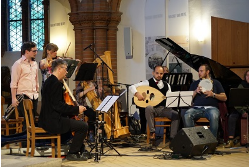
Die deutsch-syrische Musikgruppe Habibi spielt auf