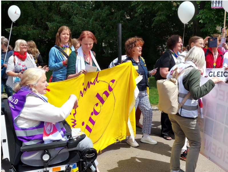
Wir sind Kirche bei der Kundgebung #Taten statt Warten von Maria 2.0