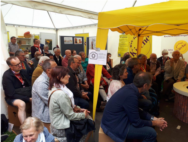
Das meist sehr gut gefüllte Wir sind Kirche-Zelt auf der Kirchenmeile