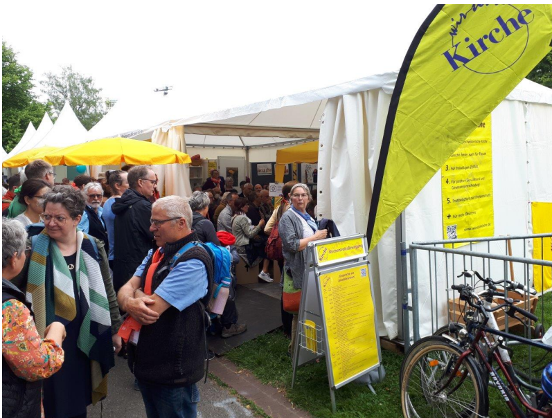
Das Wir sind Kirche-Zelt ein wirklicher Treffpunkt