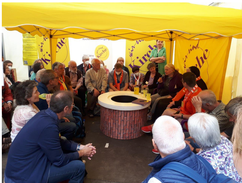
Gespräche rund um den "Jakobsbrunnen"