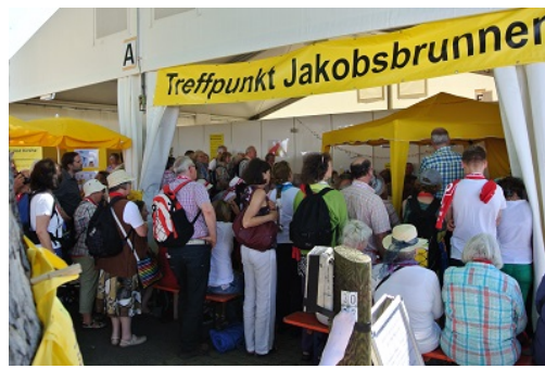
Wir sind Kirche beim Evangelischen Kirchentag 2015 in Stuttgart > mehr