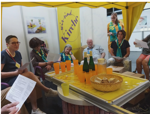
mit einfachen Mitteln vorbereitet von Sigrid Grabmeier