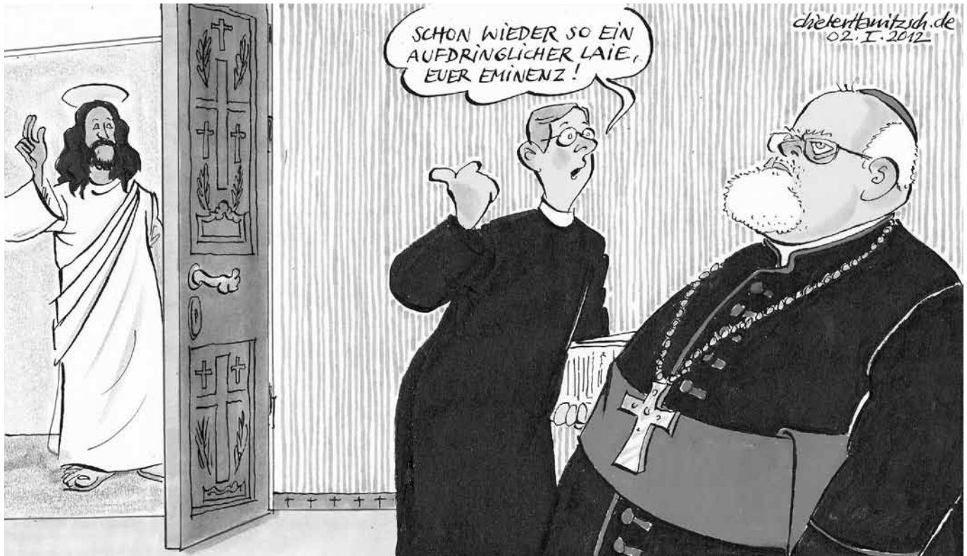
Wer heute beim Christentum alles mitreden will...